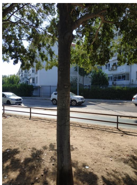
Imágenes del ejemplar con id 252