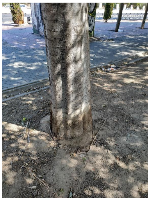
Imágenes del ejemplar con id 123055