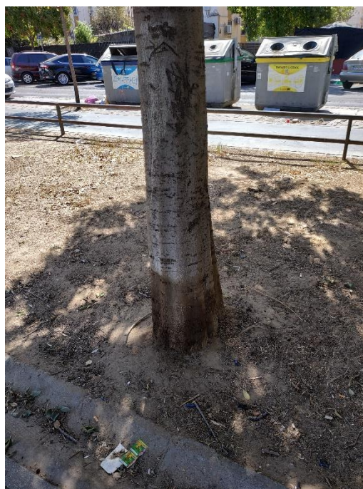
Imágenes del ejemplar con id 178