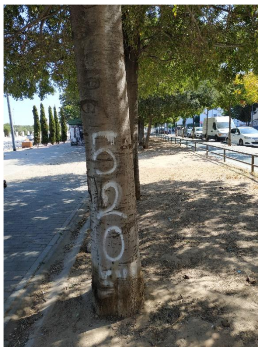
Imágenes del ejemplar con id 174