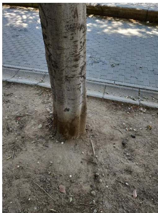
Imágenes del ejemplar con id 155