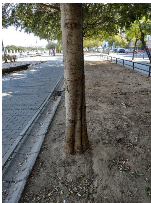
Imágenes del ejemplar con id 147