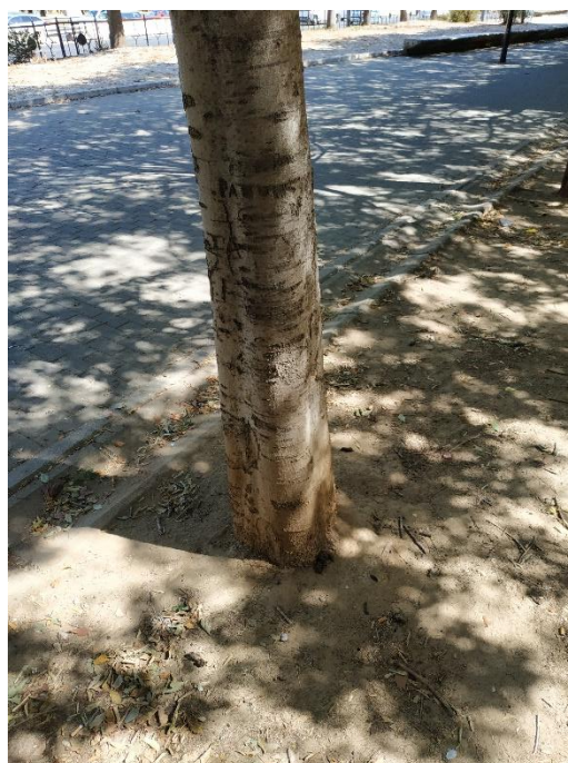
Imágenes del ejemplar con id 139