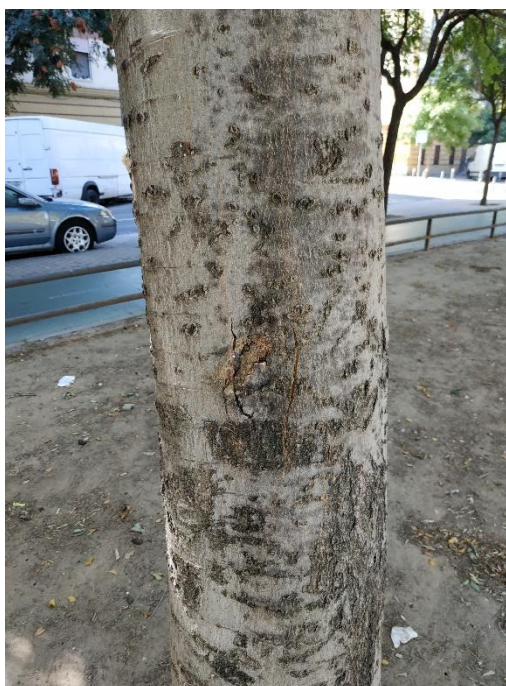
Imágenes del ejemplar con id 133