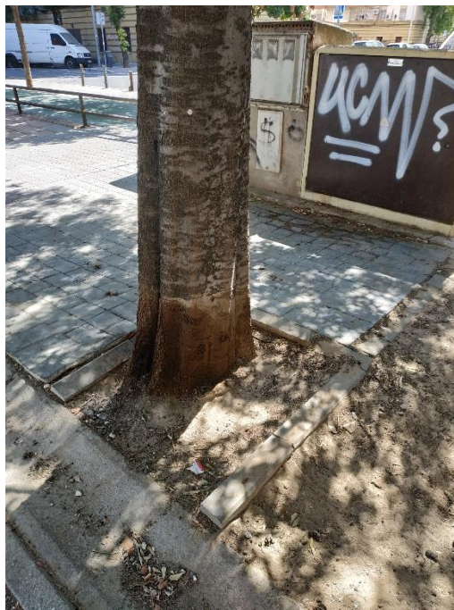
Imágenes del ejemplar con id 112