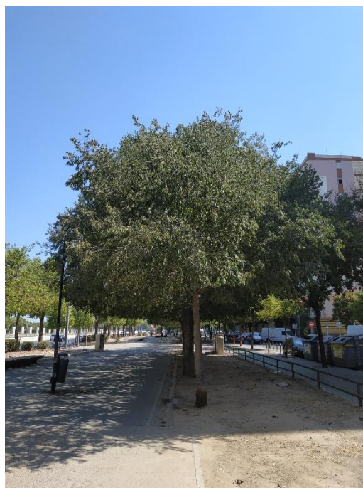
Imágenes del ejemplar con id 101