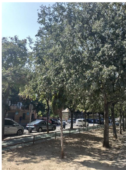
Imágenes del ejemplar con id 123208