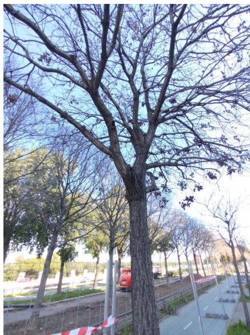
Imágenes del ejemplar con id 125403