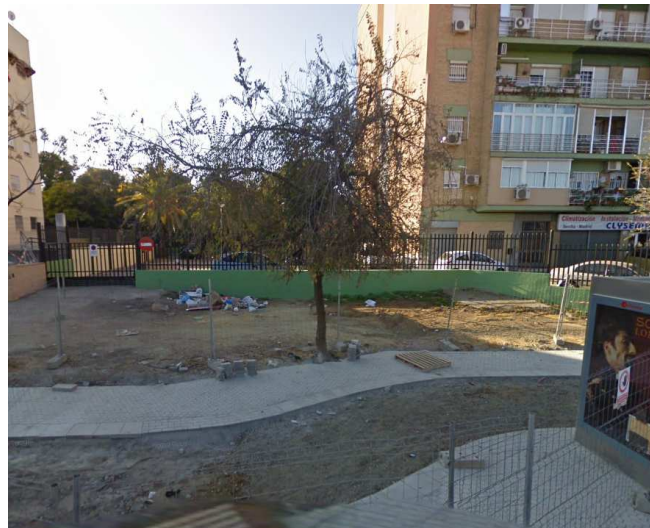
Imágen de Google Maps (diciembre de 2009)

Calle Nicolás Alpérez s/n (Pabellón de la Telefónica de la Exposición de 1929) 41013 Sevilla Teléfono 95 54 73232