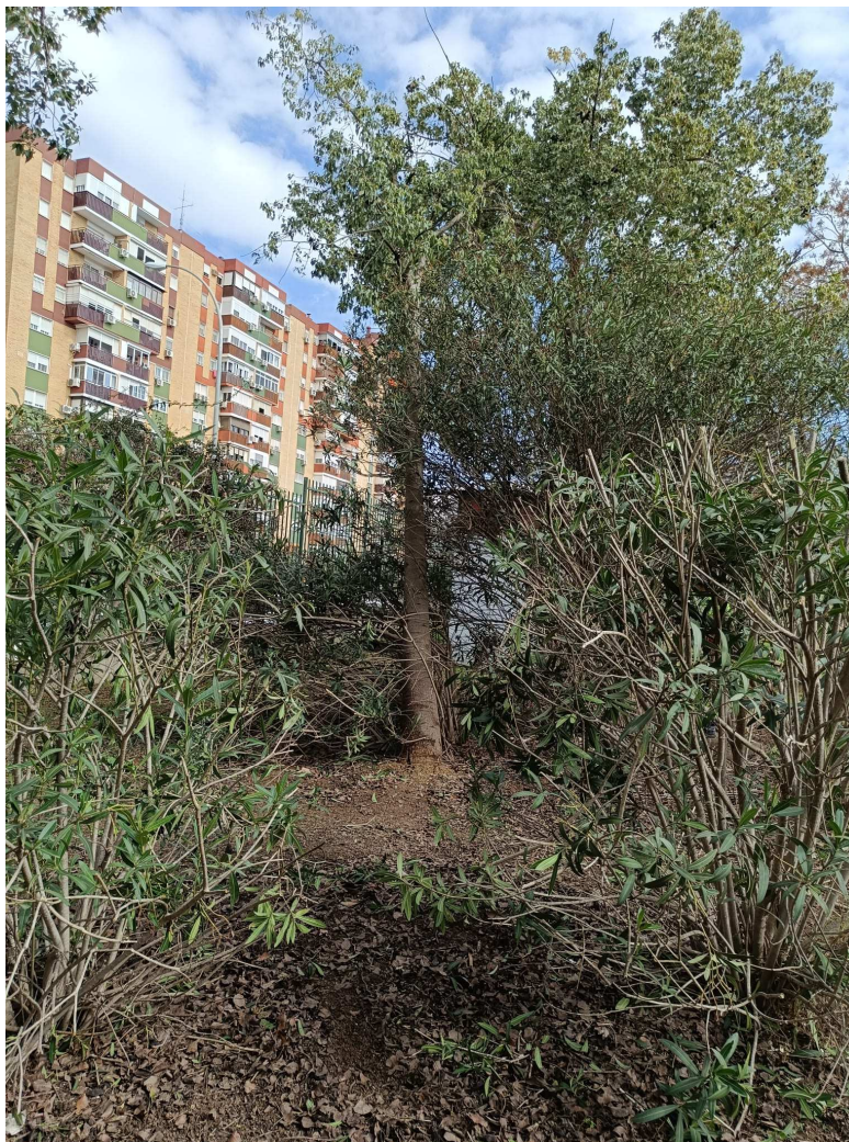
Vista general del ejemplar

Ayuntamiento de Sevilla Plaza Nueva, 1 41001 Sevilla +34 955 010 010 www.sevilla.org