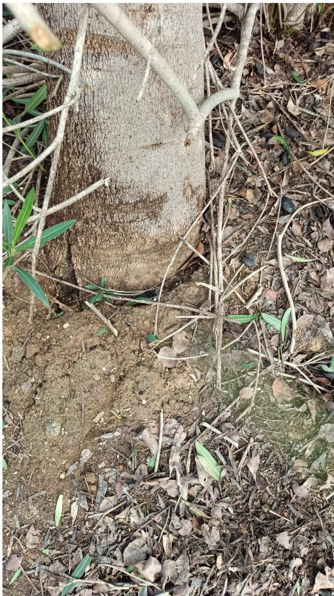
Detalle del fallo del plato radicular

Ayuntamiento de Sevilla Plaza Nueva, 1 41001 Sevilla +34 955 010 010 www.sevilla.org