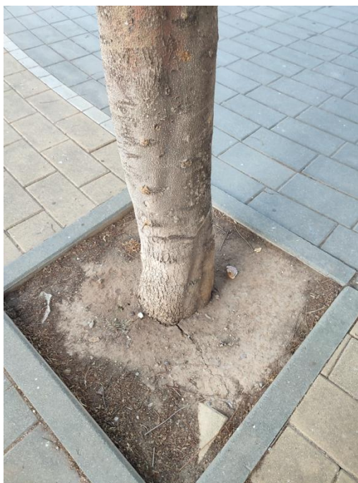
Imágenes del ejemplar con id 40495