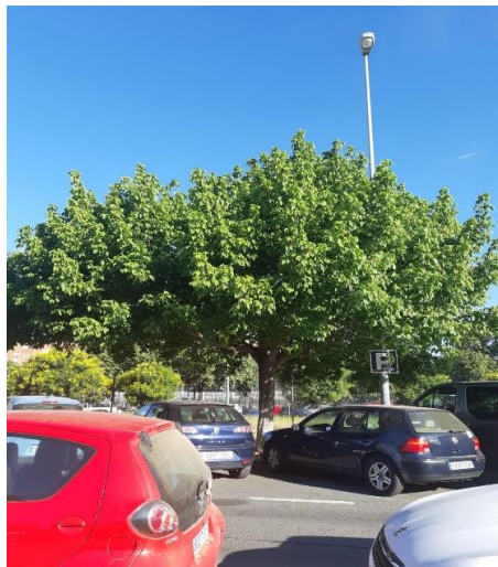
(Imagen de porte correspondiente a la inspección realizada el 22/10/2025)

Calle Nicolás Alpérez s/n (Pabellón de la Telefónica de la Exposición de 1929) 41013 Sevilla Teléfono 95 54 73232