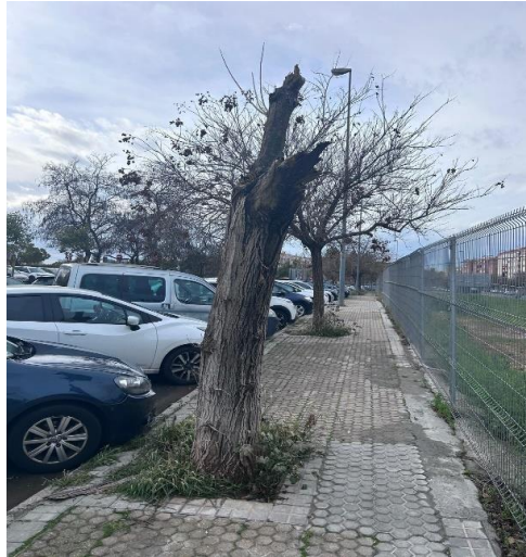
(Imagen tomada el día de su apeo)